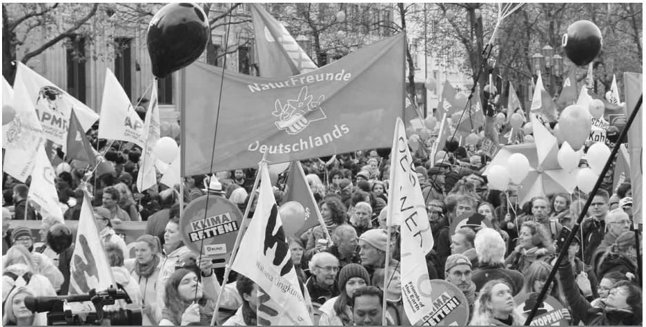
Demonstration am 4.11.2017 in Bonn: Klima schützen - Kohle stoppen! 25.000 Menschen demonstrierten für Klimaschutz und Kohleausstieg