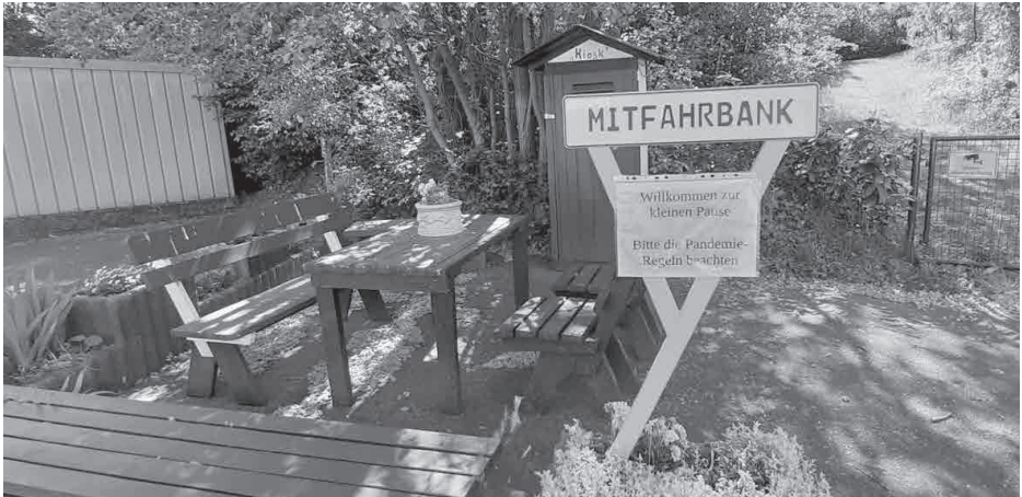
Gute Idee! Unterwegs an der Wupper bei Krebsöge

Abfahrt: D-Hbf. um 9:37 Uhr mit S1 (Gleis 14) bis Mülheim-Styrum, ca. 14 km, Wanderzeit ca. 4 Std., Eigenverpfl. u. Schlusseinkehr wenn möglich. Führung: Wilhelm Hausche, Tel. 0211-2293848