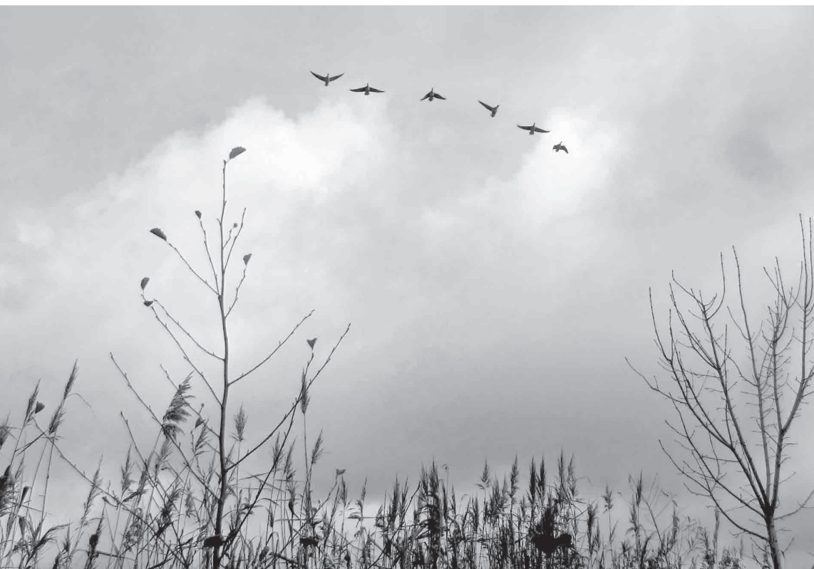
Gänse über den Rieselfeldern bei Münster