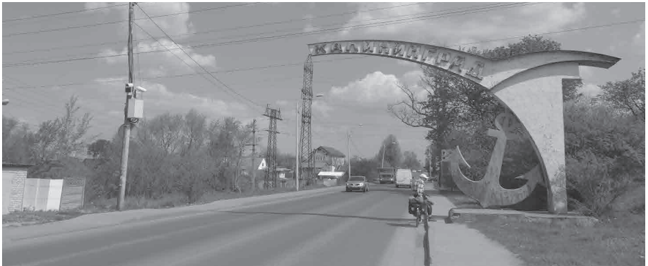
Einfahrt nach Kaliningrad

1100 km auf dem polnischen, russischen und litauischen Ostseeküstenradweg, Vortrag und Diaschau von Birgit und Volker Götz