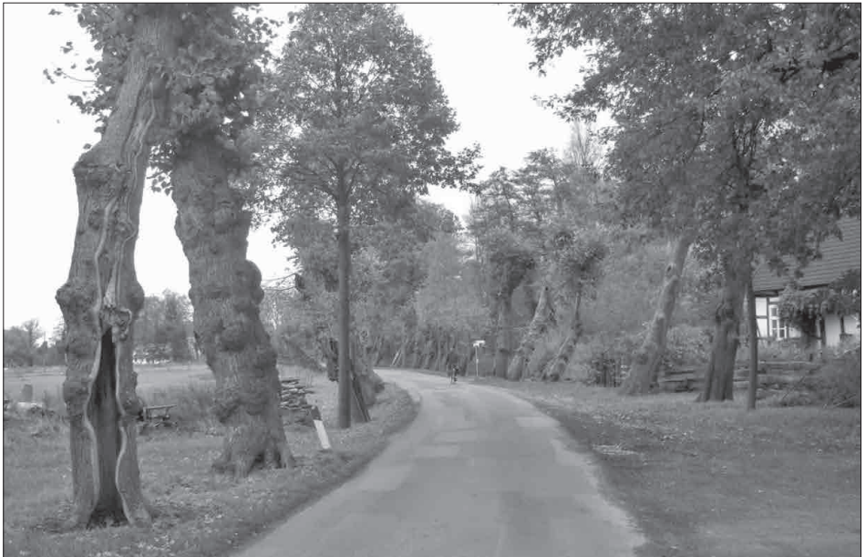
Lindenallee bei Kalkriese

im NFH Gerresheim ab 19:30 Uhr. Wer möchte, kann gerne ein kulinarisches Häppchen beisteuern. Planung der Touren für das kommende Jahr, Rückblick auf Touren in diesem Jahr, Jahreshauptversammlung .